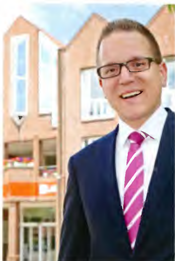
Sebastian Seidel - Bürgermeister -