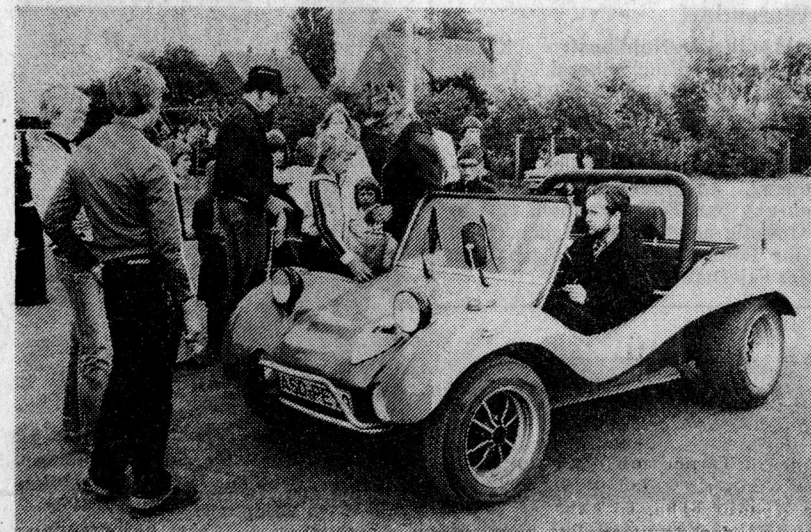
Das knallrote Auto war für den Nachwuchs eine besondere Überraschung bei der Kinderbelustigung

Heute um 17 Uhr wird das neue Königspaar feierlich gekrönt, um 19.30 Uhr beginnt dann die Polonäse mit dem anschließenden Königsball in der Feierhalle.